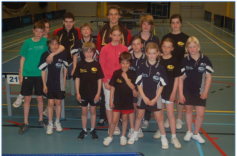
Het Oost-Vlaamse team, op enkele spelers na die al ontsnapt waren op het einde

Drie jaar geleden arriveerden we nog op de 5e plaats, twee jaar geleden op de 4e plaats, vorig jaar opnieuw op de 4e plaats en dit jaar voor het eerst op de 3e plaats. Ons nieuwste resultaat hebben we deels te danken aan een onvolledige opkomst van sommige andere provincies. Langs de andere kant is onze voltallige en kwalitatieve formatie een verdienste van de jeugdwerking in de clubs, de provincie en de topsportschool. Laat ons daarbij ook zeker niet de ouders vergeten, die veel moeite doen voor de ondersteuning van het sportieve leven van zoon- of dochterlief. Volgend jaar spelen we thuis in eigen provincie en kunnen we hopelijk onze opmars bevestigen.